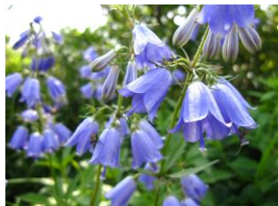
ハクサンシャジン