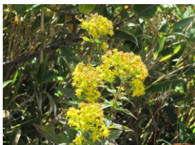
アキノキリンソウ