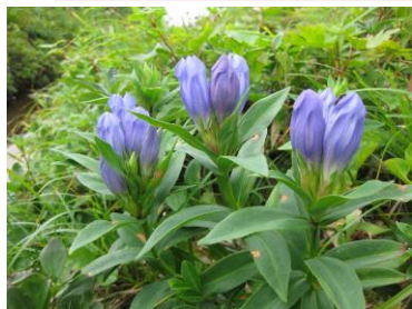
エゾオヤマノリンドウ