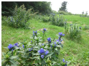
ゴンドラ山頂駅のエゾオヤマノリンドウ